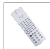
710842 Télécommande pour paramétrage du déecteur de mouvement