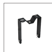
710823 Etrier pour fixation murale