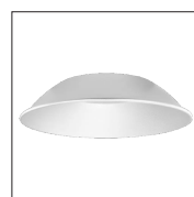
190704 Réflecteur Aluminium, angle 90° (Ø396 x H80mm)