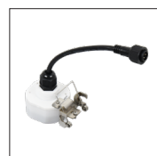
710729 Détecteur de présence