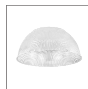
190706 Réflecteur PC prismatique, angle 70° (Ø414 x H180mm)